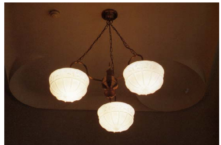
重役室の天井・照明器具

□ 展示説明会 10月1日（土）13:30-14:00 / 15:00-15:30 10月2日（日）11:00-11:30 / 13:00-13:30