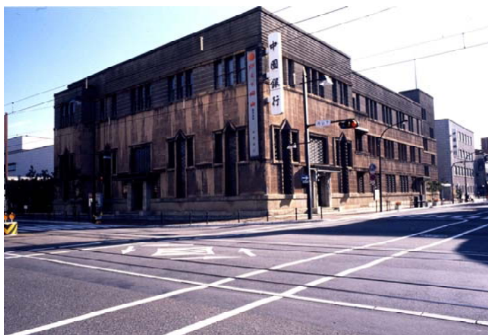
外観 独逸表現主義的様相