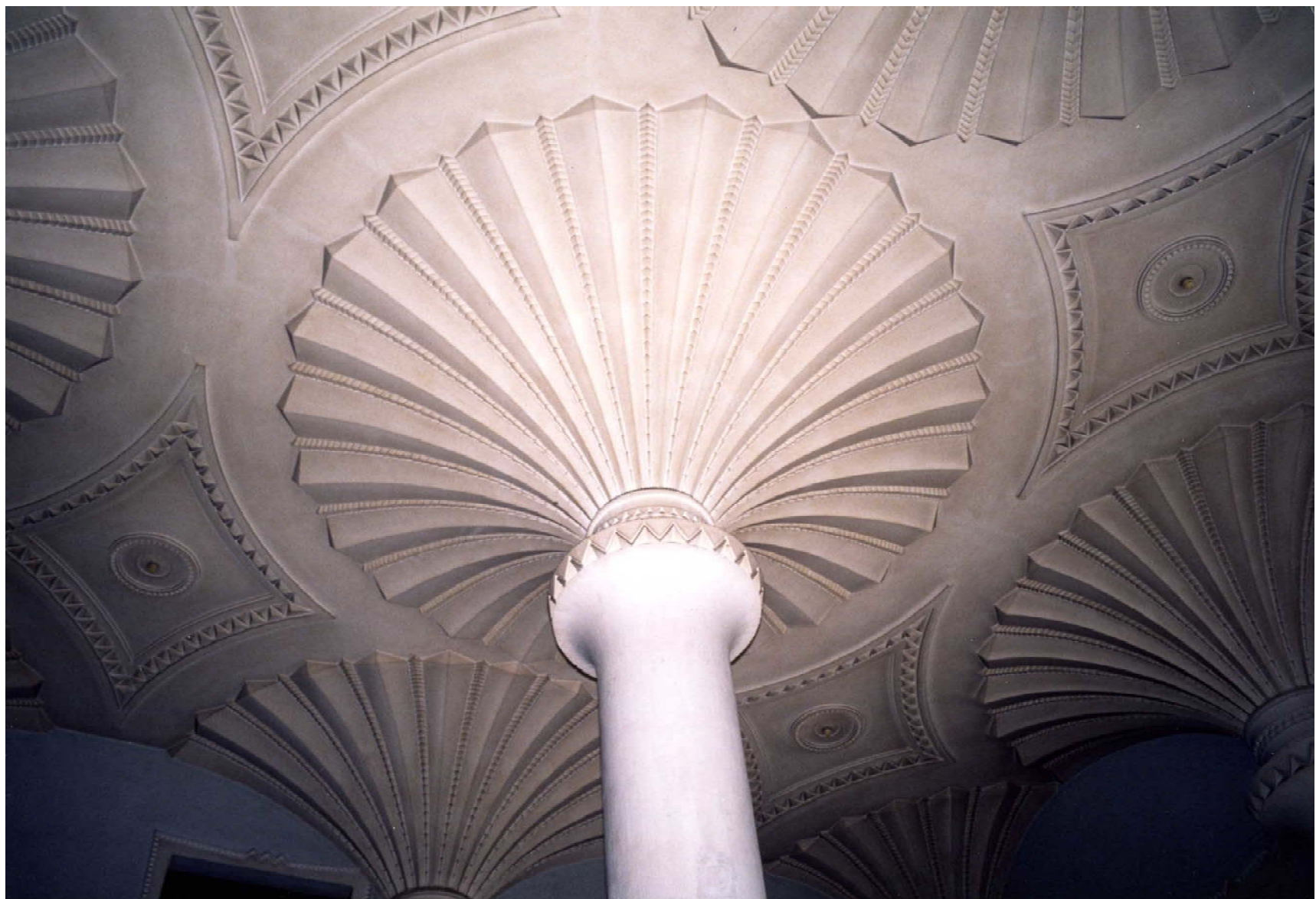
一階営業室 フェニックス（不死鳥）をテーマに表現