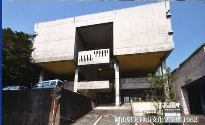
岡山県天神山文化プラザ 1962